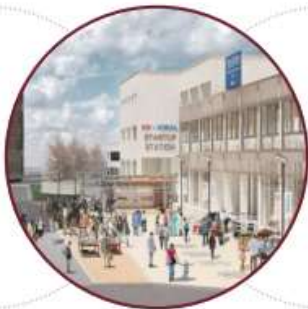
选定为构建首尔校园社区 的事业单位