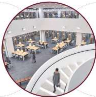
具备高尖端技术 ICT技术 的中央图书馆